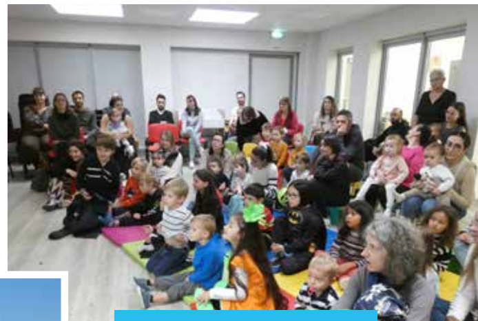
Séance de lecture sur le thème d'Halloween à Chatulivre .